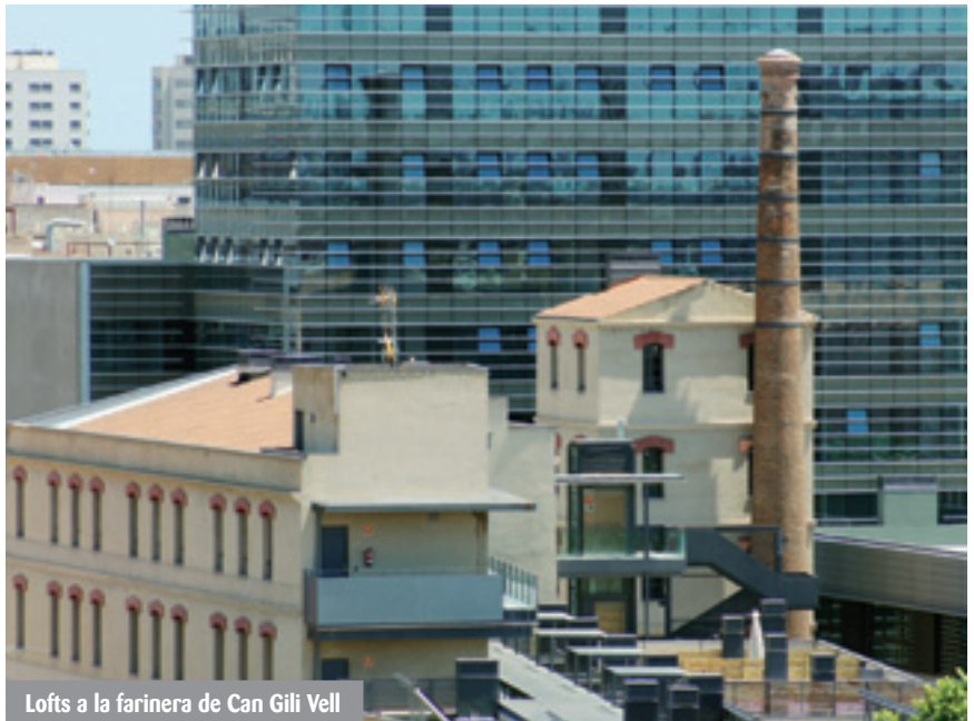
Lofts a la farinera de Can Gili Vell