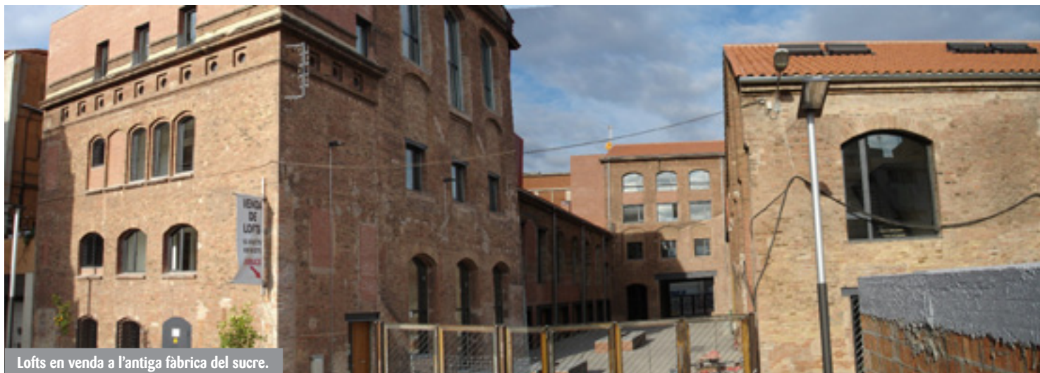
Lofts en venda a l'antiga fàbrica del sucre.