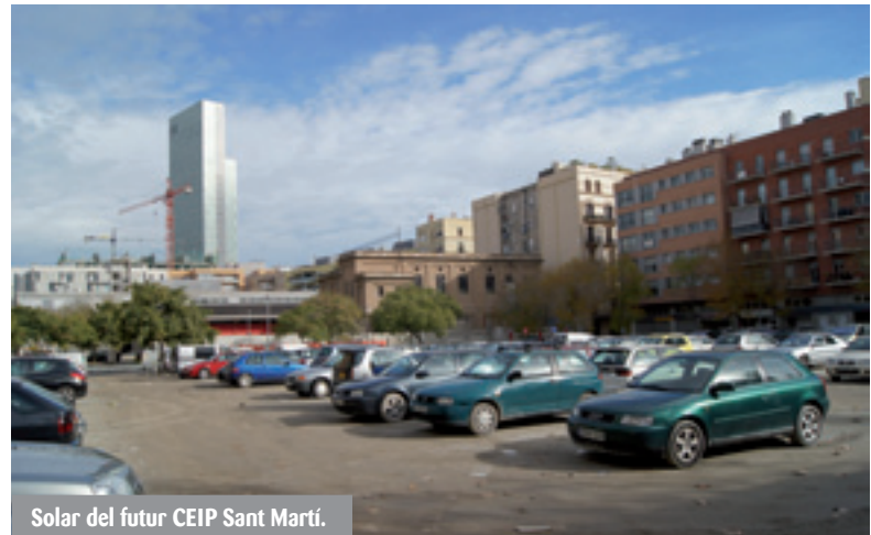
Solar del futur CEIP Sant Martí.

Tot i que alguns veïns residents des de fa pocs anys a la zona han demanat convertir el solar de la Rambla amb Sancho d'Àvila en un espai verd, aquesta àrea està qualificada d'equipament públic. La nova escola Sant Martí i el Centre de Barri contribuiran a donar