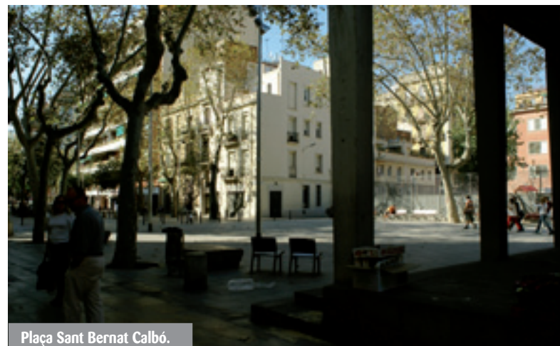
Plaça Sant Bernat Calbó.

Ens sentim estafats i impotents: paguem els nostres impostos; ens venen que ara l'administració està més a prop gràcies a la nova divisió de barris, als tècnics de barris i als consells de veïns, però quan tenim un problema, ben bàsic d'altra banda (només demanem que l'Ajuntament compleixi una de les seves obligacions bàsiques), de què ens serveix tot això si l'única resposta és la