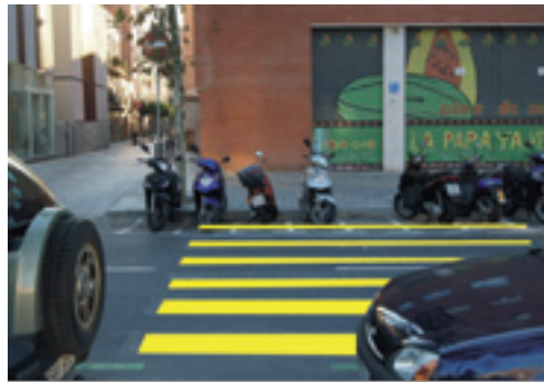
Simulació del pas de vianants que va ser eliminat al carrer Bilbao.

En qualitat de veí de la zona, vull denunciar que el 4 de novembre passat es va suprimir el pas de zebra del carrer Bilbao cantonada amb carrer Amistat. Aquest pas és el que fa servir la majoria de gent que va i torna del mercat, i és el que comunica la plaça de Júlio González amb el casc antic i eix comercial del barri (suposadament zona de vianants); de fet, és el pas natural i lògic de qualsevol